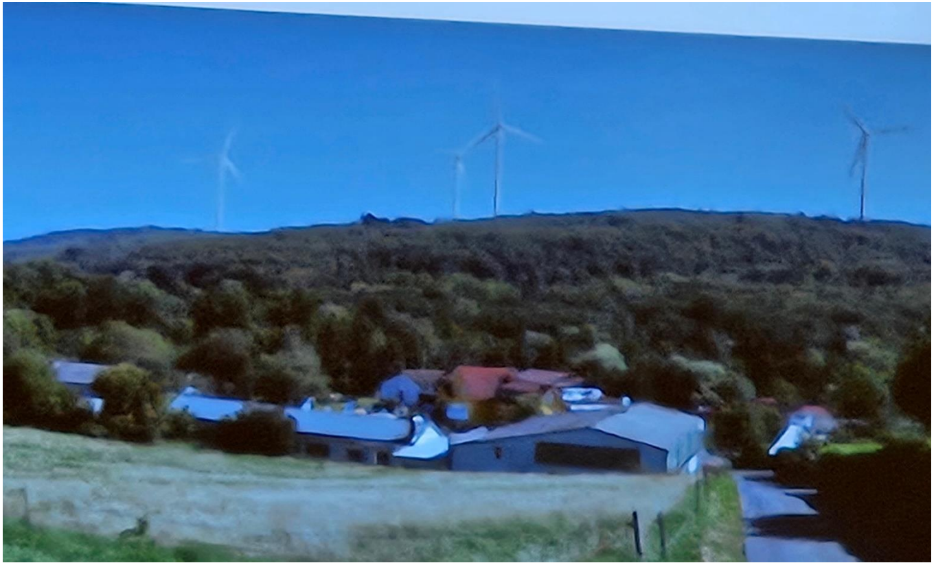
Die WEA auf dem „Stein“ Richtung Usenborn