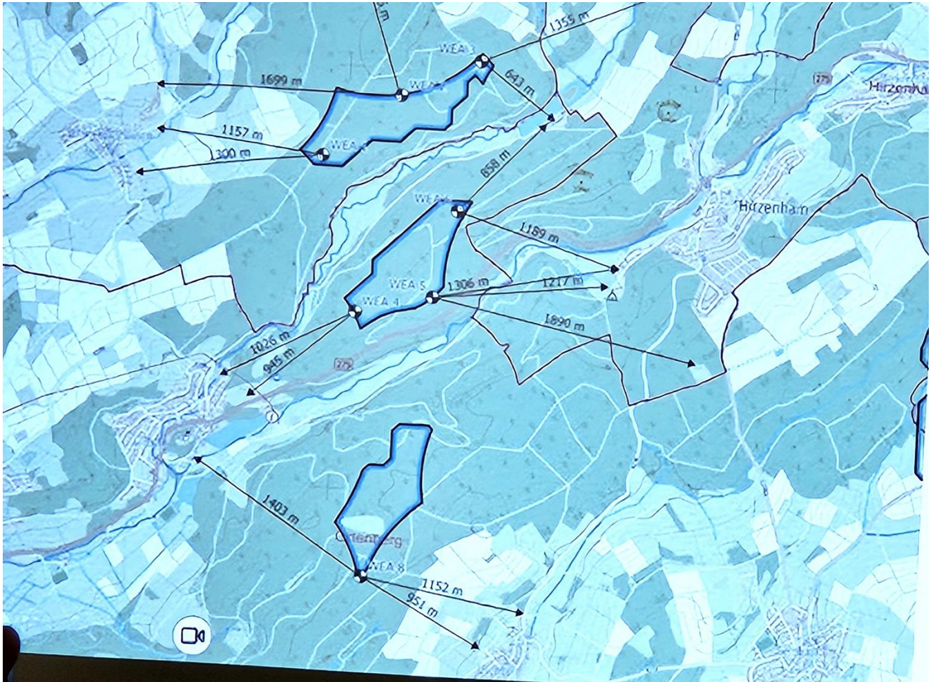
Die Abstände zur Wohnbebauung