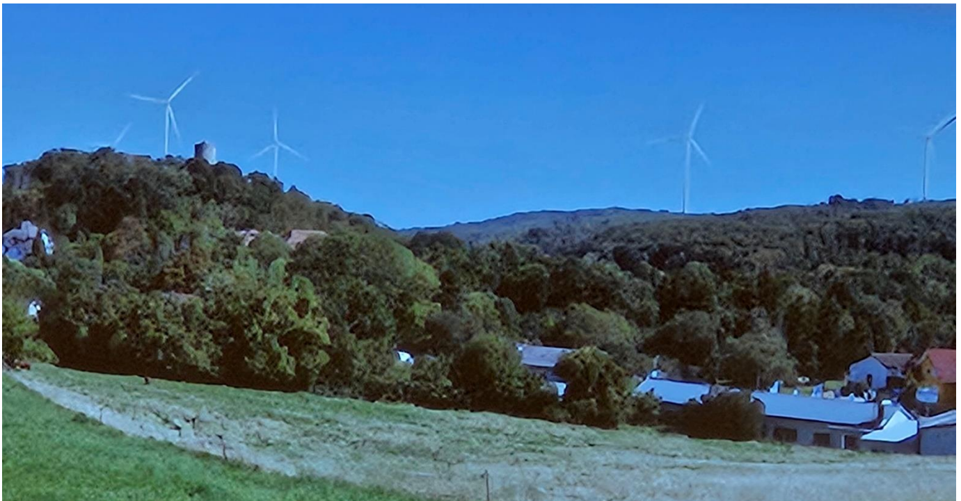
Ansicht der WEA`s Höllberg – Stein Auf der linken Seite käme noch die WEA Kleekopf hinzu.

Die Bilder sind Fotomontagen, die bei der Veranstaltung gezeigt wurden.