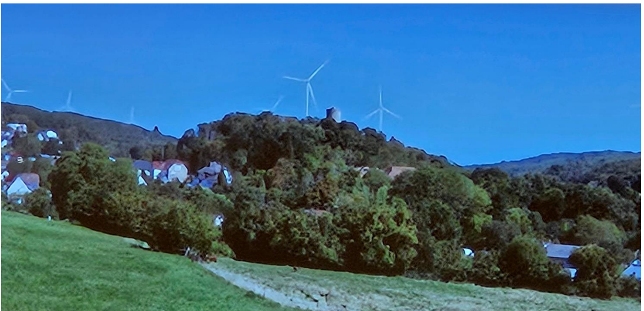
Hinter dem Burgturm von Lißberg die WEA „Höllberg“ Links die WEA auf dem „Kleekopf“ bei Schwickartshausen